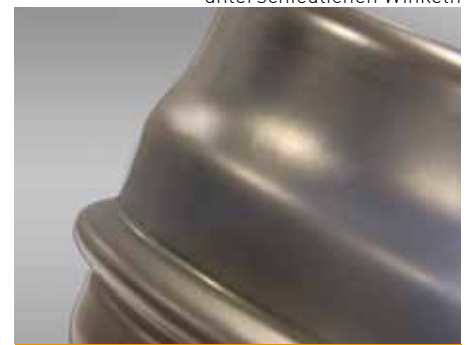
Verschiedene Absetzungen mit unterschiedlichen Winkeln