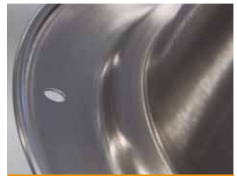
Verschiedene Absetzungen mit unterschiedlichen Winkeln